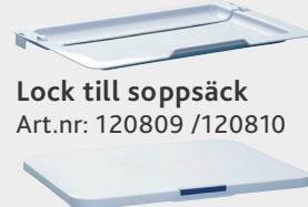
Lock till sopsäck